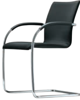
S 81 Design Thonet