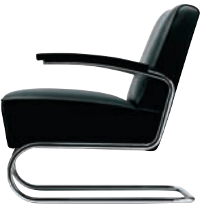
S 411 Design Thonet