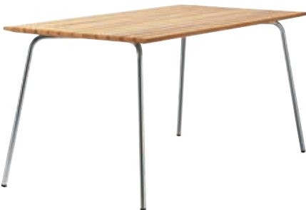
S 1040 Design Thonet