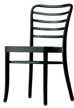
140 Design Thonet