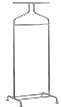
GF 26 Design Thonet