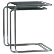
B 97 a/b Design Thonet