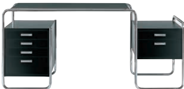
S 285 Design Marcel Breuer