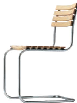
S 40 Design Thonet Artistic copyright Mart Stam