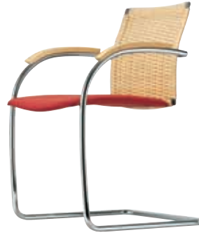
S 78 R Design Andreas Krob