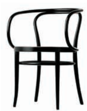
209 Design August Thonet