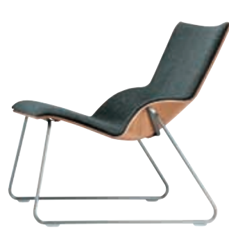
S 555 P Design Jehs & Laub