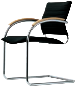
S 73 F Design Josef Gorcica