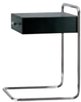
B 117 Design Thonet