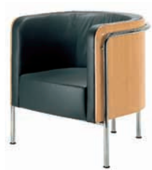
S 3001 Design Christoph Zschocke