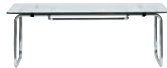
B 18 a Design Marcel Breuer