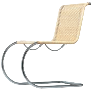
S 533 R Design Ludwig Mies van der Rohe