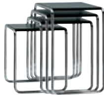
B 9 a -d Design Marcel Breuer