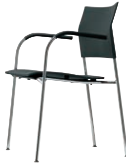
S 360 F Design Delphin Design