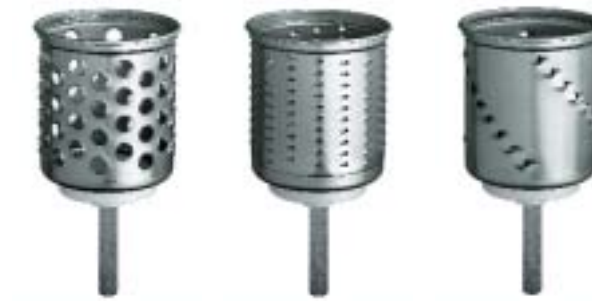
ZUSATZTROMMELN GEMÜSESCHNEIDER (EMVSC)