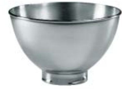
3 LITER SCHÜSSEL (KB3SS)