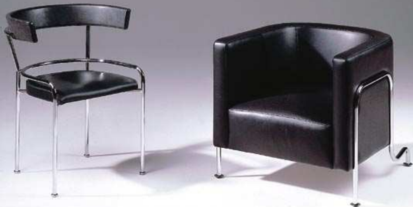
GA-1 & GA-2 BY GUNNAR ASPLUND